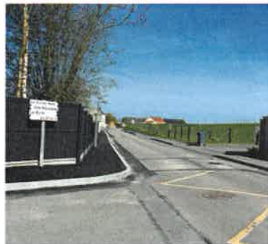
Trottoirs le long de la D252 - Houquetot