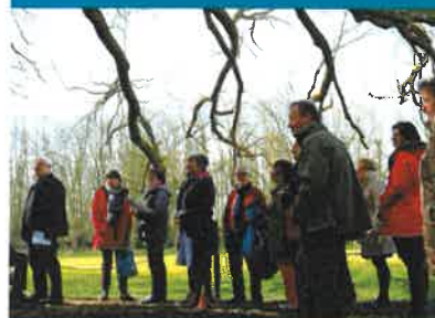
Educteur - Domaine du Grand Daubeuf