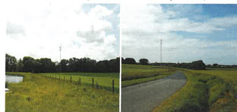
Daubeuf-Serville (à gauche) implantation d'un pylône de 30 m / chemin rural n°15. Bec-de-Mortagne, implantation d'un pylône de 45m / route de la Ferme Bultot - D69

dans le meilleur des cas pour juin 2018, au plus tard avant la fin de l'année 2018. Les habitants pourront alors bénéficier d'une réception téléphonique en 2G et en 4G.