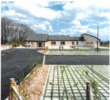
Parking - Saint-Maclou-la-Brière