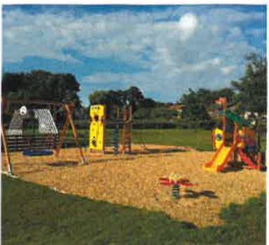
Aire de jeux - Mentheville